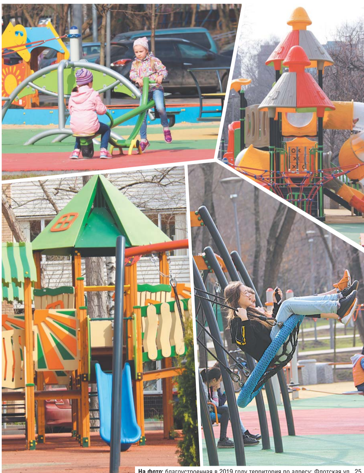
На фото: благоустроенная в 2019 году территория по адресу: Флотская ул., 25.