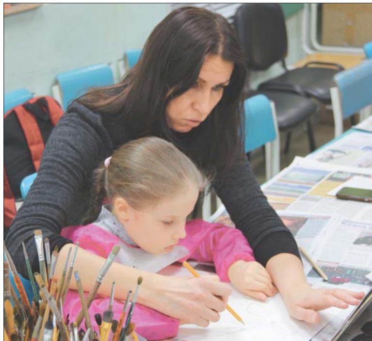
Юная художница рисует вместе с мамой