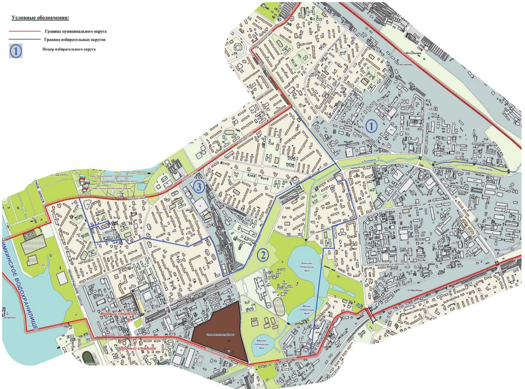
Схема многомандатных избирательных округов по выборам депутатов Совета депутатов муниципального округа Головинский в городе Москве